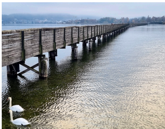
Ponte di Rapperswil

Alle 09:00, ritrovo alla reception per la visita guidata di Rapperswil (circa 2 ore). Dopo il pranzo al ristorante, ci rechiamo sullo spettacolare ponte di legno per una rilassante passeggiata. Il resto del pomeriggio e la cena saranno liberi.