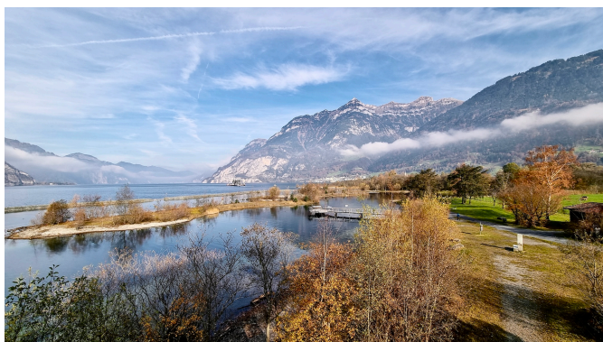
Delta della Reuss

Partenza dal Ticino con destinazione Seedorf (UR) . Qui potremo assaporare la pace immergendoci con una guida per due ore nella natura del Delta della Reuss. Se portate il pic-nic potrete poi sedervi su una panchina in riva al Lago dei Quattro Cantoni (nell'immagine).